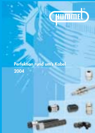
Kabel- und Schlauch- verschraubungssysteme